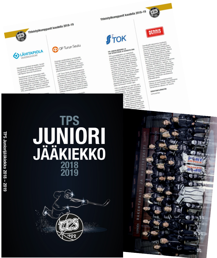
Mallisivut ovat vuoden 2018–2019 matrikelista.

Kirja ilmestyy vuoden 2019 lopulla ja on noin 220-sivuinen, pehmeäkantinen sekä liimasidottu.