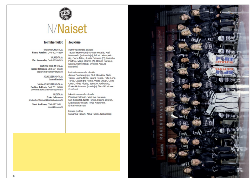
Aukeama vuoden 2018–2019 matrikelista